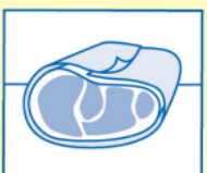
ドリップシートの代わりに