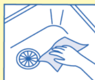
カウンタークロス代わりに