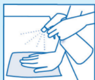
除菌スプレー後の拭き取り