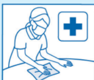
医療現場の拭き取り