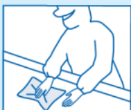
生産ラインの清掃